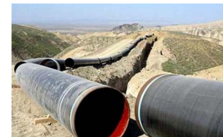
Διέλευση του αγωγού φυσικού αερίου από το Κιλκίς