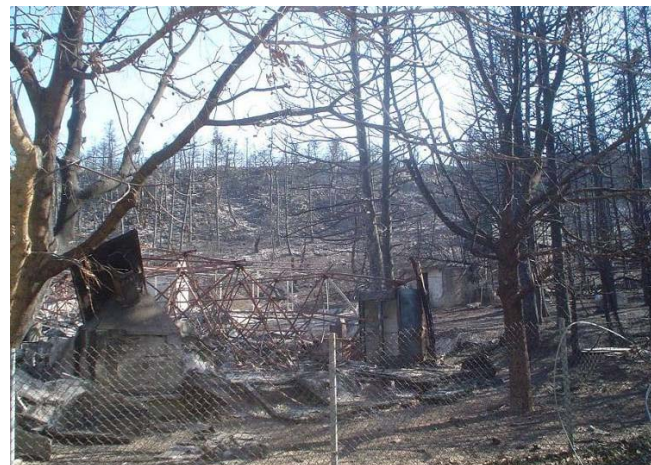
η Πάρνηθα μετά τις πυρκαγιές