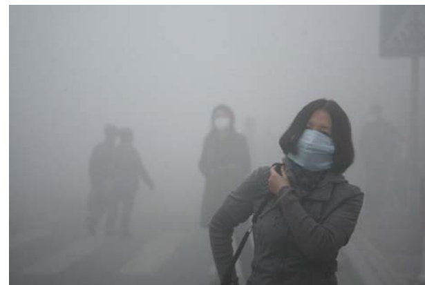
εικόνες από την αναπτυσσόμενη Κίνα

Στην περιοχή της Πτολεμαΐδας δύο από τα εργοστάσια της ΔΕΗ φιγουράρουν ανάμεσα στις τριάντα πιο ρυπογόνες βιομηχανίες της Ευρώπης, ενώ είναι εμφανείς οι επιπτώσεις στην υγεία των κατοίκων της περιοχής: παιδιά γεννιούνται με προβλήματα υγείας, νέοι άνθρωποι πεθαίνουν από καρκίνο.