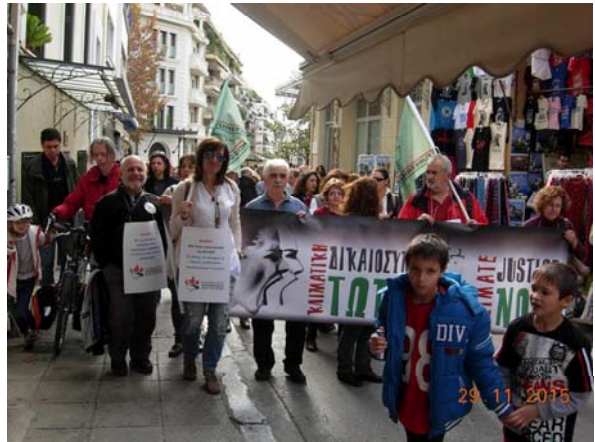
Αθήνα, πεζόδρομος Δ. Αεροπαγίτη, Οκτώβριος 2015