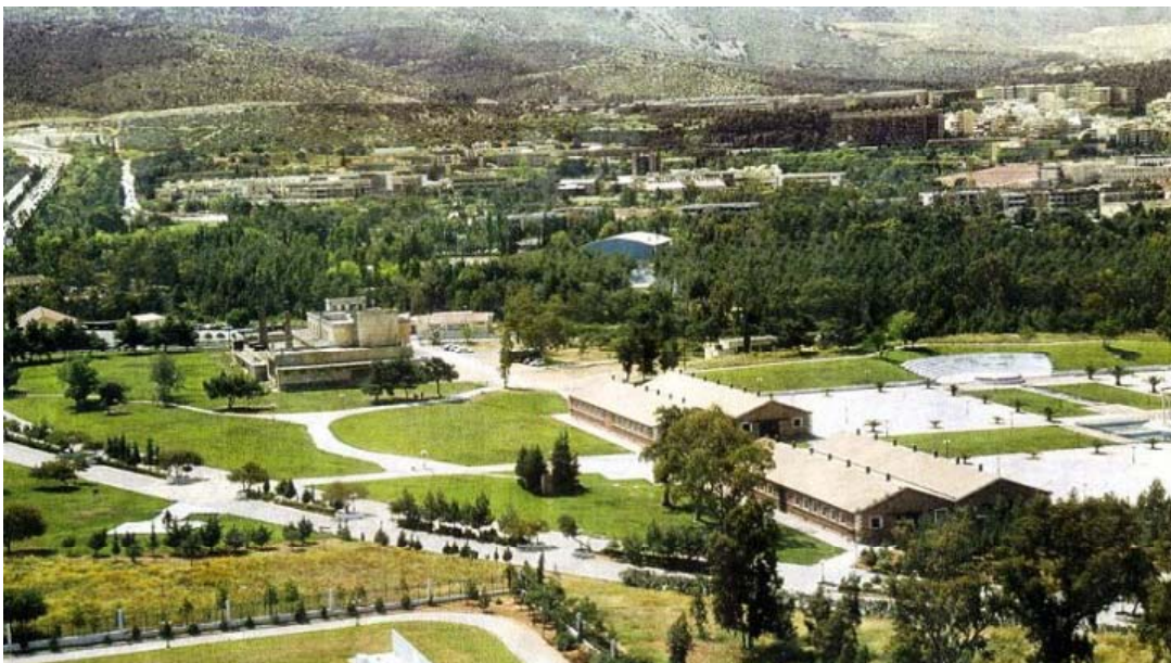
Μητροπολιτικό Πάρκο Γουδή- Ιλισίων

Όσον αφορά την Αττική είναι επιτακτική ανάγκη να αναθεωρηθεί το Ρυθμιστικό Σχέδιο Αθήνας με κριτήριο τη διαφύλαξη της αγροτικής γης, την απαγόρευση της εκτός σχεδίου δόμησης, την προστασία δασών και δασικών εκτάσεων, την ελεγχόμενη χωροθέτηση του τριτογενούς τομέα, την εφαρμογή των αρχών της συνεκτικής πόλης και την αναβάθμιση/προστασία των βιομηχανικών ζωνών από την ανεξέλεγκτη και επικίνδυνη για τη δημόσια υγεία και το περιβάλλον ρύπανση. Στο πλαίσιο των μέτρων προσαρμογής στην κλιματική αλλαγή, που οφείλει να σχεδιάσει η χώρα μας σύμφωνα με τις κατευθύνσεις της Διάσκεψης του Παρισιού, τα περιβαλλοντικά κινήματα μπορεί να θέσουν κατά προτεραιότητα τους παραπάνω στόχους μαζί με την προστασία και επέκταση ιδιαίτερα των μεγάλων πράσινων χώρων του λεκανοπεδίου. Στη δράση αυτή υπάγονται τα τρία μητροπολιτικά πάρκα : Γουδή- Ιλισίων, Ελαιώνα, Ελληνικού. Ένα σημαντικότατο θέμα που συνδέεται με τους αέριους και άλλους ρύπους είναι η διαχείριση των απορριμμάτων στην Αττική και όλη την Ελλάδα, όπου σήμερα επανέρχονται σ' εφαρμογή εργολαβικά συστήματα καύσης.