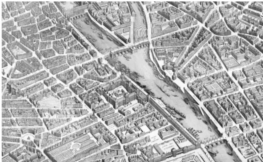
Παρίσι, 1734 Plan Turgot