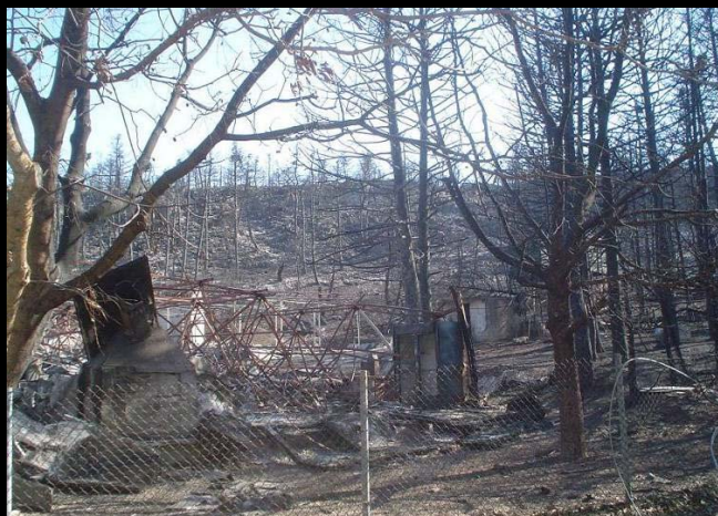
η Πάρνηθα μετά τις πυρκαγιές