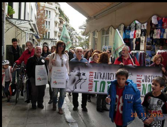
Αθήνα, πεζόδρομος Δ. Αεροπαγίτη, Οκτώβριος 2015