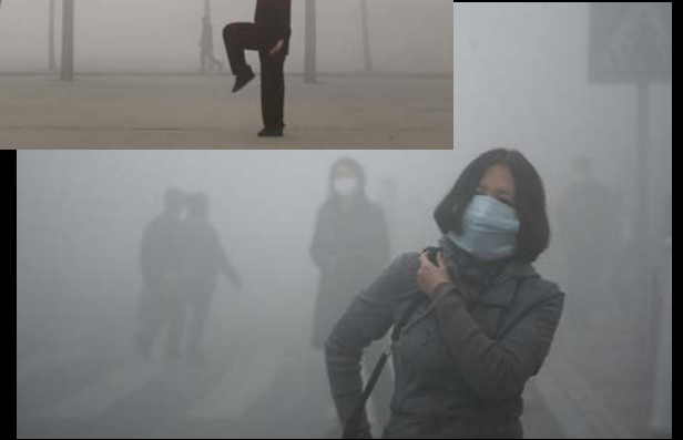
εικόνες από την αναπτυσσόμενη Κίνα.