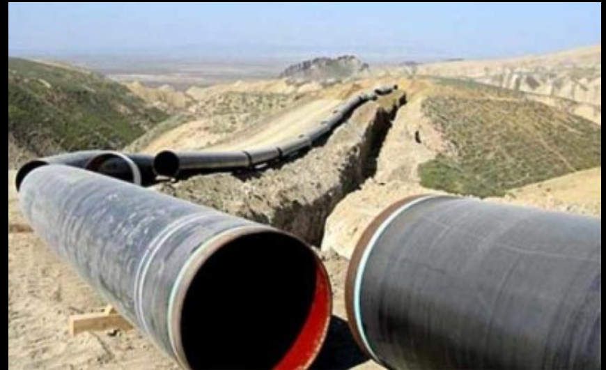
Διέλευση του αγωγού από το Κιλκίς