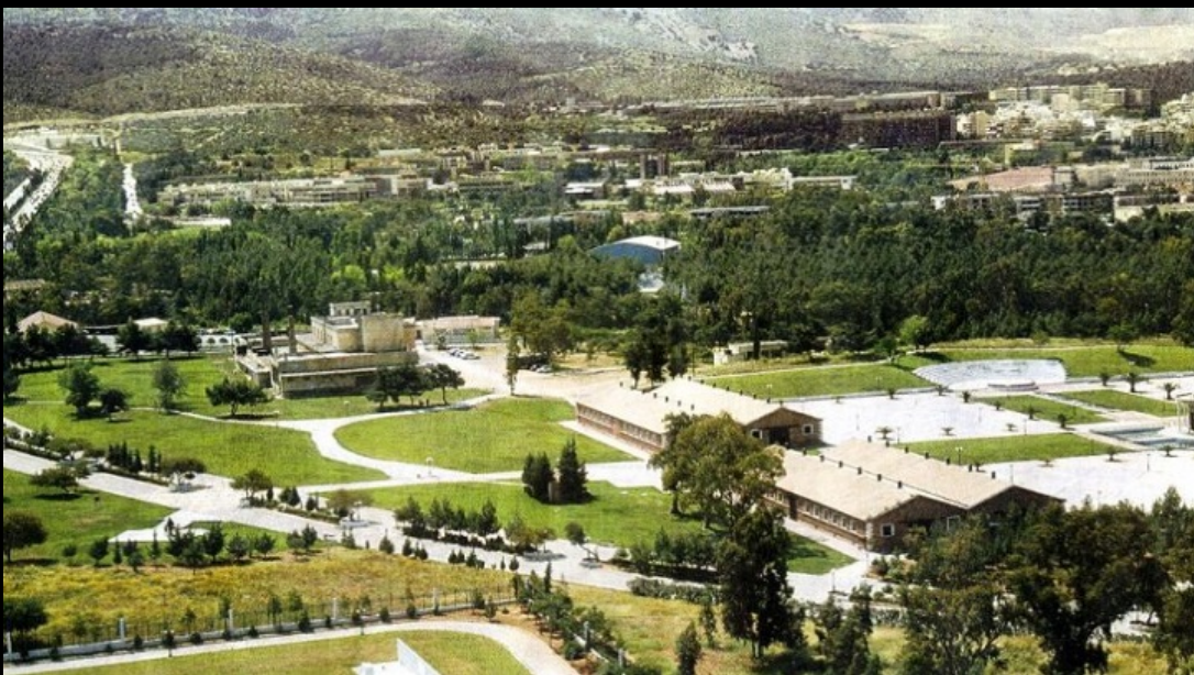
Μητροπολιτικό Πάρκο Γουδή- Ιλισίων

Όσον αφορά την Αττική είναι επιτακτική ανάγκη να αναθεωρηθεί το Ρυθμιστικό Σχέδιο Αθήνας με κριτήριο τη διαφύλαξη της αγροτικής γης, την απαγόρευση της εκτός σχεδίου δόμησης, την προστασία δασών και δασικών εκτάσεων, την ελεγχόμενη χωροθέτηση του τριτογενούς τομέα, την εφαρμογή των αρχών της συνεκτικής πόλης και την αναβάθμιση/προστασία των βιομηχανικών ζωνών από την ανεξέλεγκτη και επικίνδυνη για τη δημόσια υγεία και το περιβάλλον ρύπανση. Στο πλαίσιο των μέτρων προσαρμογής στην κλιματική αλλαγή, που οφείλει να σχεδιάσει η χώρα μας σύμφωνα με τις κατευθύνσεις της Διάσκεψης του Παρισιού, τα περιβαλλοντικά κινήματα μπορεί να θέσουν κατά προτεραιότητα τους παραπάνω στόχους μαζί με την προστασία και επέκταση ιδιαίτερα των μεγάλων πράσινων χώρων του λεκανοπεδίου. Στη δράση αυτή υπάγονται τα τρία μητροπολιτικά πάρκα : Γουδή- Ιλισίων, Ελαιώνα, Ελληνικού. Ένα σημαντικότατο θέμα που συνδέεται με τους αέριους και άλλους ρύπους είναι η διαχείριση των απορριμμάτων στην Αττική και όλη την Ελλάδα, όπου σήμερα επανέρχονται σ' εφαρμογή εργολαβικά συστήματα καύσης.