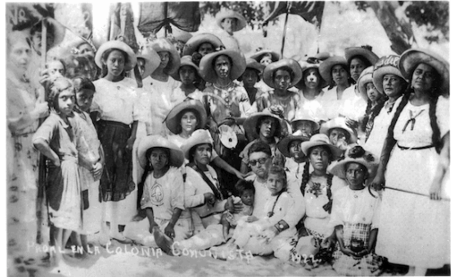
Γυναίκες στη Βερακρούζ, 1922

Δύο σημαντικά ιστορικά κινήματα που έθεσαν δημόσια το δικαίωμα στην κατοικία είναι η Απεργία Ενοικίων στη Γλασκόβη το 1915 και το Κίνημα των Ενοικιαστών στη Βέρα Κρούζ το 1922. Τα κινήματα αυτά οργανώθηκαν εξ ολοκλήρου από γυναίκες και το πρώτο οδήγησε στην πρώτη θεσμοθέτηση της κατοικίας ως υποχρέωσης του κράτους. Ο τρόπος οργάνωσης βασίστηκε στην αρχή της άμεσης δημοκρατίας και της ισότιμης συμμετοχής όλων. Οι γυναίκες ξεκίνησαν δυναμικά, δημιούργησαν επιτροπές σε κάθε συγκρότημα κατοικίας, αντιστάθηκαν στις εξώσεις συγκρουόμενες με την αστυνομία και στη Βέρα Κρούζ βγήκαν στο δρόμο και αντιμετώπισαν τον στρατό. Η μεταγενέστερη ιστορία των ευρωπαϊκών κοινωνικών κινήματων για την κατοικία επαληθεύει τη μαζική και καθοριστική συμμετοχή των γυναικών.