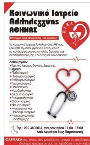
Κοινωνικό Ιατρείο – Φαρμακείο Αθήνας