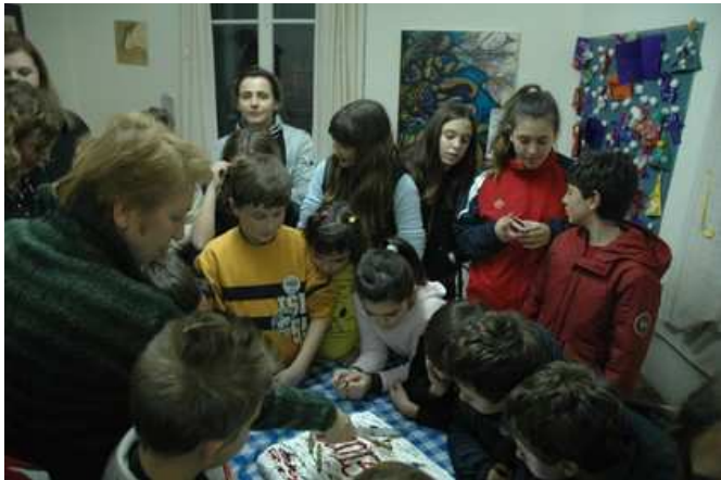
Λέσχη Αλληλεγγύης Νέου Κόσμου

Στις σημερινές δομές αλληλεγγύης που αναπτύσσονται στην Ελλάδα της κρίσης, με βασικά αντικείμενα την τροφή και την υγεία, η συμμετοχή των γυναικών είναι καταλυτική. Όπως ακριβώς αγωνίστηκαν και αγωνίζονται για το κοινωνικό κράτος που αποτελεί αντικείμενο της αυτοδιοίκησης έτσι ακριβώς αναλαμβάνουν και αυτόνομες πρωτοβουλίες για την αντιμετώπιση καταστάσεων έκτακτης ανάγκης