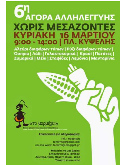
Δίκτυο Αλληλεγγύης «Το μωρμύγκι»