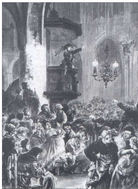
Λέσχη Γυναικών στην εκκλησία του Σαιν-Ζερμέν-λ'Ωξερουά