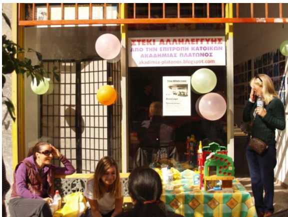
Λέσχη Αλληλεγγύης Ακαδημίας Πλάτωνος