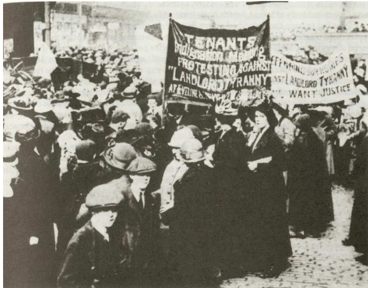
Απεργία Ενοικίων στη Γλασκόβη, 1915