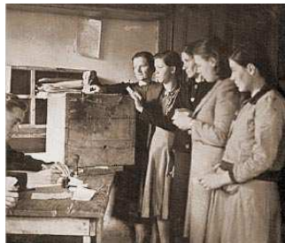
Οι γυναίκες ψηφίζουν