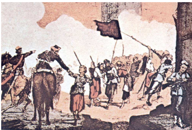
Το οδόφραγμα της πλατείας Μπλανς που υπεράσπιζαν μόνο γυναίκες