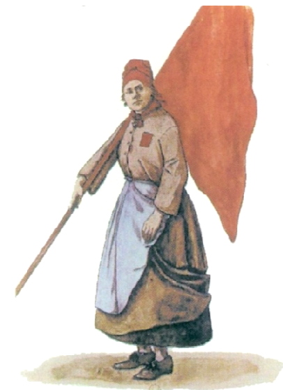
Γυναίκα της Κομμούνας