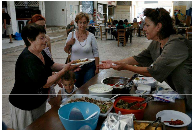
Δημοτική Αγορά της Κυψέλης